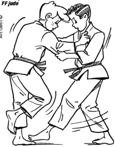
TSUBAME-GAESHI RETOUR DE L'HIRONDELLE (CONTRE DU BALAYAGE)