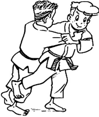
ASHI-GURUMA ENROULEMENT AUTOUR DE LA JAMBE