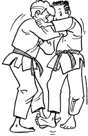
DE-ASHI-BARAI BALAYAGE DU PIED AVANCÉ