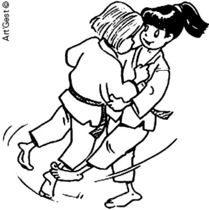
OKURI-ASHI-BARAI BALAYAGE DES DEUX PIEDS