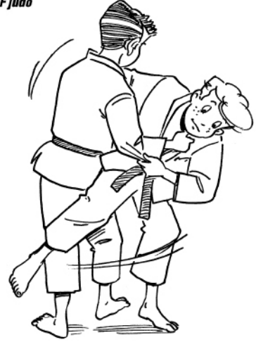
O SOTO-GURUMA GRAND ENROULEMENT EXTÉRIEUR