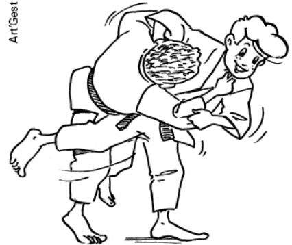
O-GURUMA GRAND ENROULEMENT