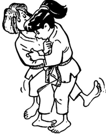
O SOTO-GARI GRAND FAUCHAGE EXTÉRIEUR