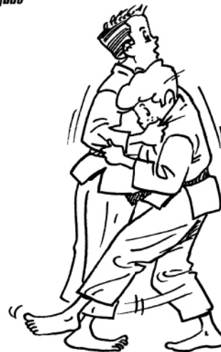
KO SOTO-GAKE PETIT ACCROCHAGE EXTÉRIEUR