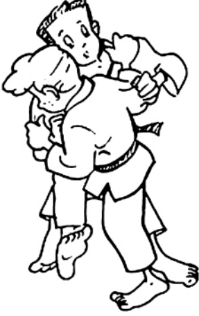
KO UCHI-GARI PETIT FAUCHAGE INTÉRIEUR