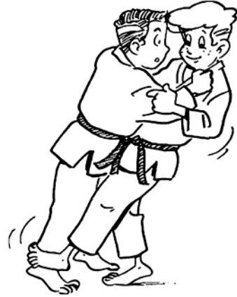
HARAI-TSURIKOMI-ASHI BALAYAGE DU PIED EN PÊCHANT