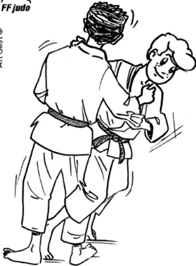
O SOTO-OTOSHI GRAND RENVERSEMENT EXTÉRIEUR