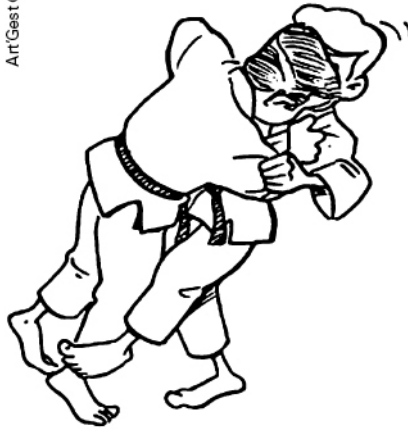
SASAE-TSURIKOMI-ASHI BLOCAGE DU PIED EN PÊCHANT