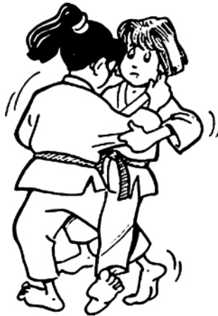
O UCHI-GARI GRAND FAUCHAGE INTÉRIEUR