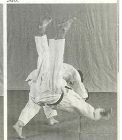
O-SOTO-GAESHI GRAND CONTRE EXTÉRIEUR