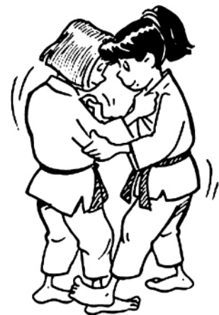
KO SOTO-GARI PETIT FAUCHAGE EXTÉRIEUR