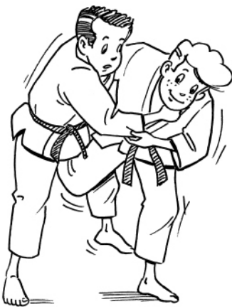
UCHI-MATA FAUCHAGE INTÉRIEUR DE LA CUISSE