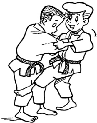
HIZA-GURUMA ROUE AUTOUR DU GENOU